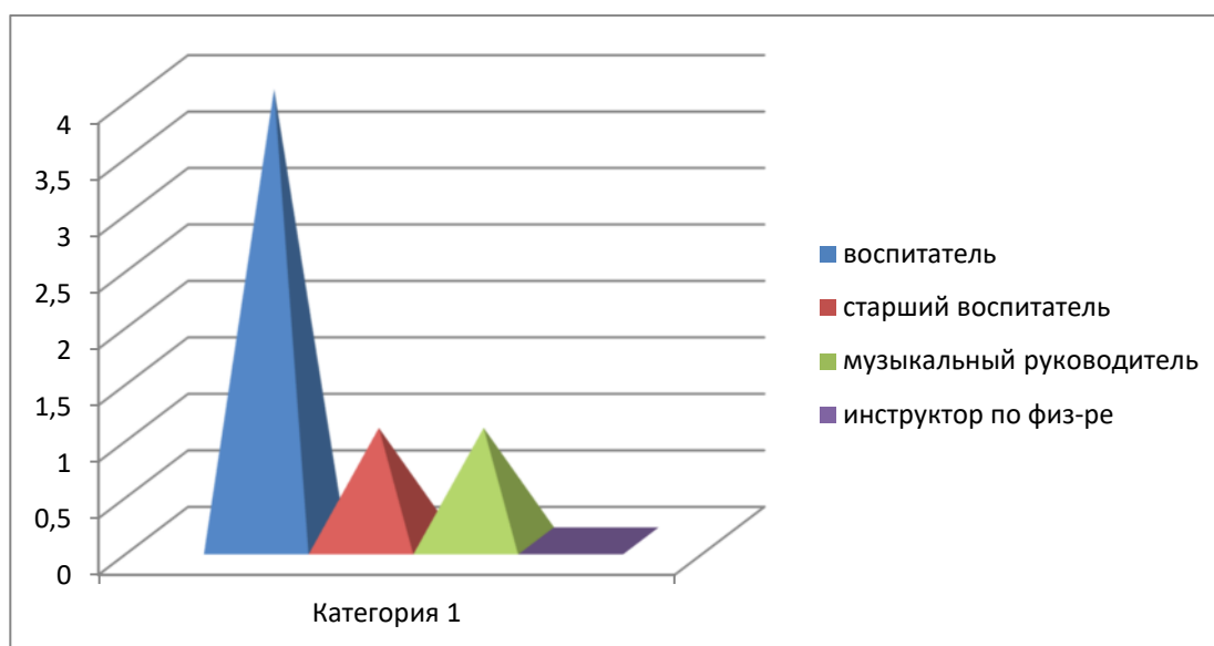
Диаграмма с характеристиками квалификационной категории кадрового состава детского сада

Курсы повышения квалификации в 2022 году прошли 2 педагогических работника детского сада. По итогам 2022 года Детский сад перешел на применение профессиональных стандартов. Из 7 педагогических работников детского сада все соответствуют квалификационным требованиям профстандарта «Педагог». Их должностные инструкции соответствуют трудовым функциям, установленным профстандартом «Педагог».